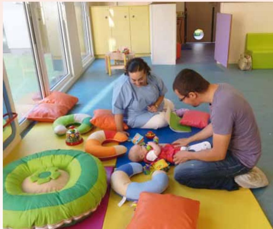
La section bébés.