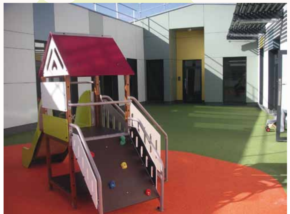
La cour intérieure