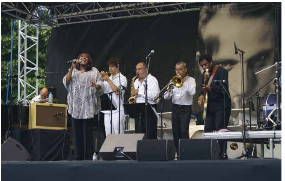
L'édition 2009 du Festival « Jazz à Vian »