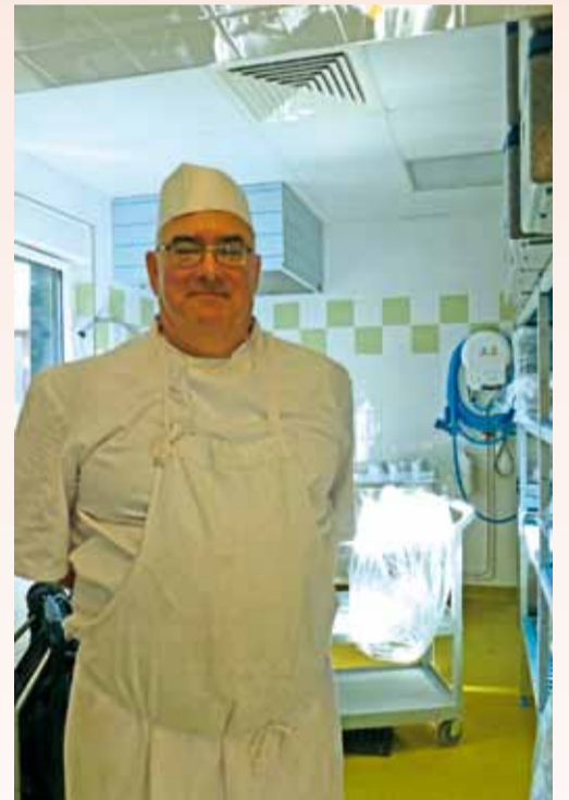
Le chef cuisinier.