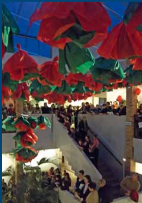
Fête de Noël 2010