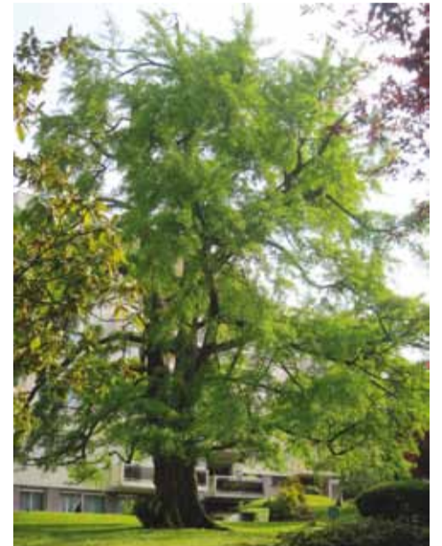
L'arbre aux quarante écus ( Ginkgo biloba ) de la résidence de Clinchamps.

plus gros du département. Ce classement relève d'une initiative du Conseil général des Hauts-de-Seine incitant les différentes villes à protéger ces arbres dans le cadre des règlements de leurs PLU (plan local d'urbanisme). Les arbres ainsi signalés font donc l'objet d'une attention particulière. Si l'arbre aux quarante écus est exceptionnel en situation isolée, il est assez couramment utilisé en alignement, à l'instar de ceux de la rue Le Corbusier à Boulogne-Billancourt ou de la rue de l'Égalité à Issy-les-Moulineaux. •