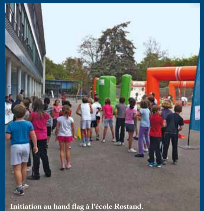
Initiation au hand flag à l'école Rostand.

* Le hand flag est un jeu collectif de balle dérivé du handball. Il s'agit d'une version édulcorée de ce sport destinée à être pratiquée sans aucun contact ni équipement de protection particulier, les contacts étant remplacés par des foulards. Il est donc particulièrement adapté aux équipes mixtes.