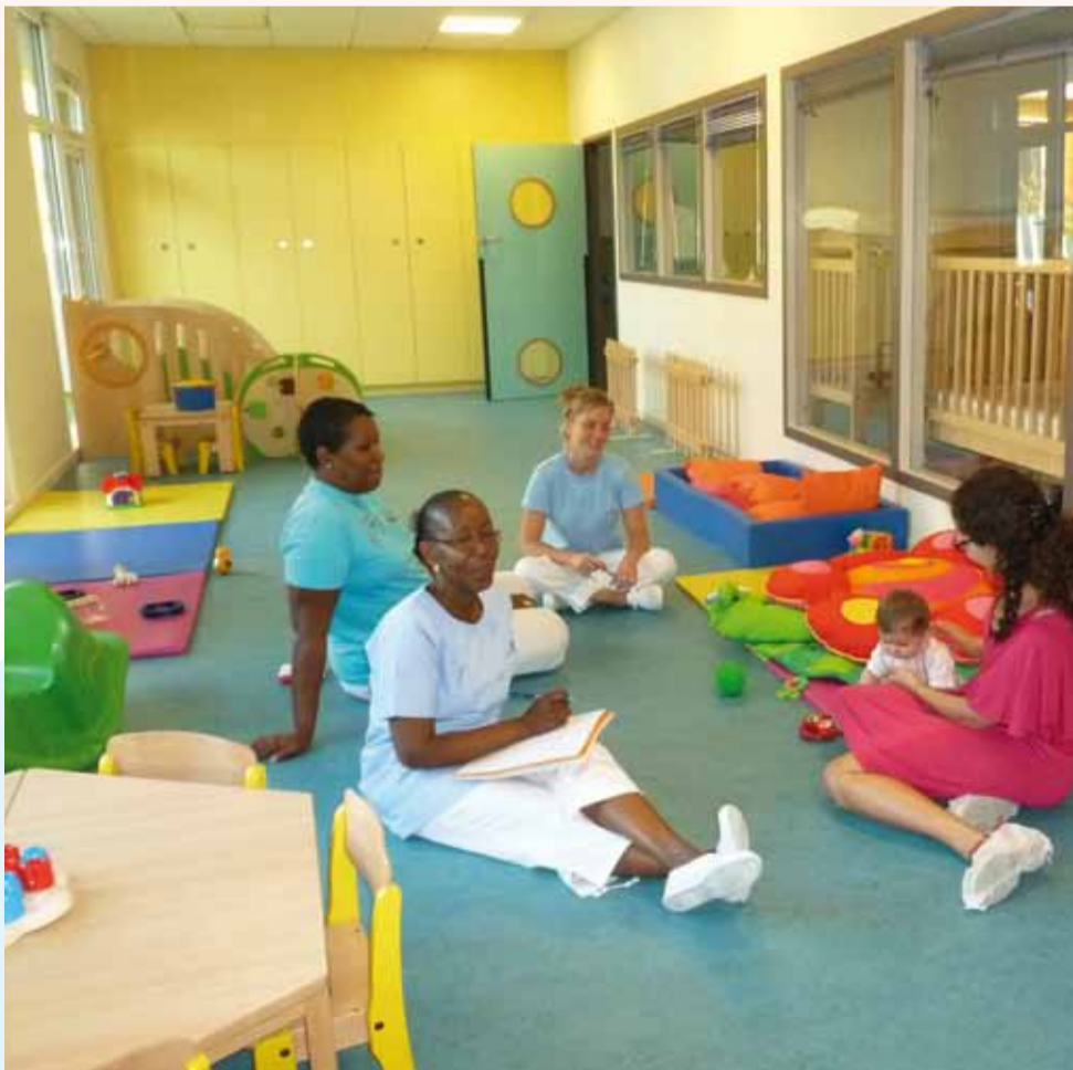
Une partie de l'équipe de la section des bébés moyens.

Renseignements : Service Petite Enfance au 01 41 15 87 94