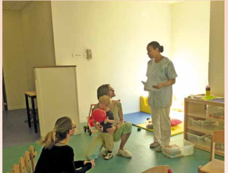
La section des grands.