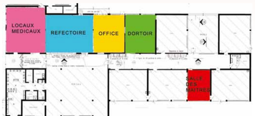
Plan du rez-de-chaussée après travaux