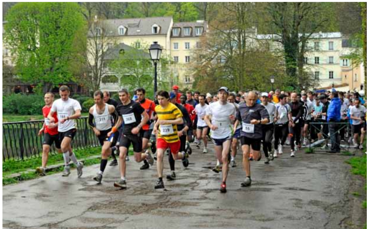
Le départ des coureurs sur le 17km