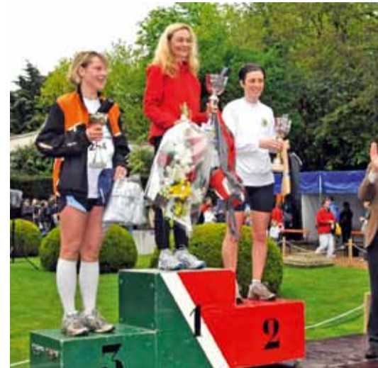
Les remises de prix aux gagnantes du 17km.