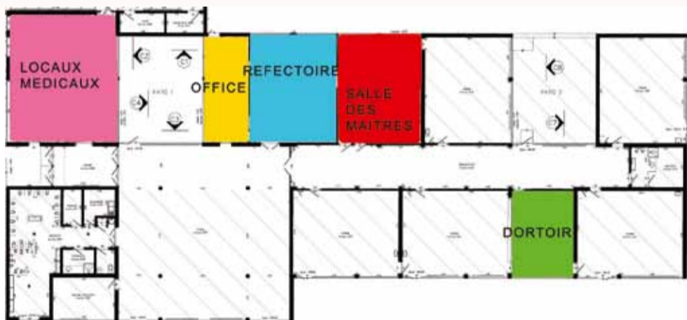
Plan du rez-de-chaussée existant

Souhaitons que ces aménagements pensés pour l'agrément des enfants plaisent aux petits et aux grands ! ●