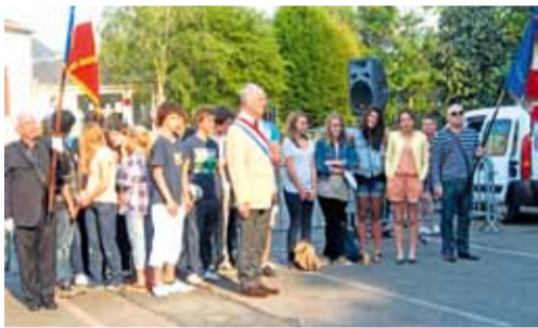
Une classe de 3 e du Collège, un mois après avoir visité le camp d'Auschwitz.

Extrait du discours prononcé par Denis Badré devant notre Monument aux morts