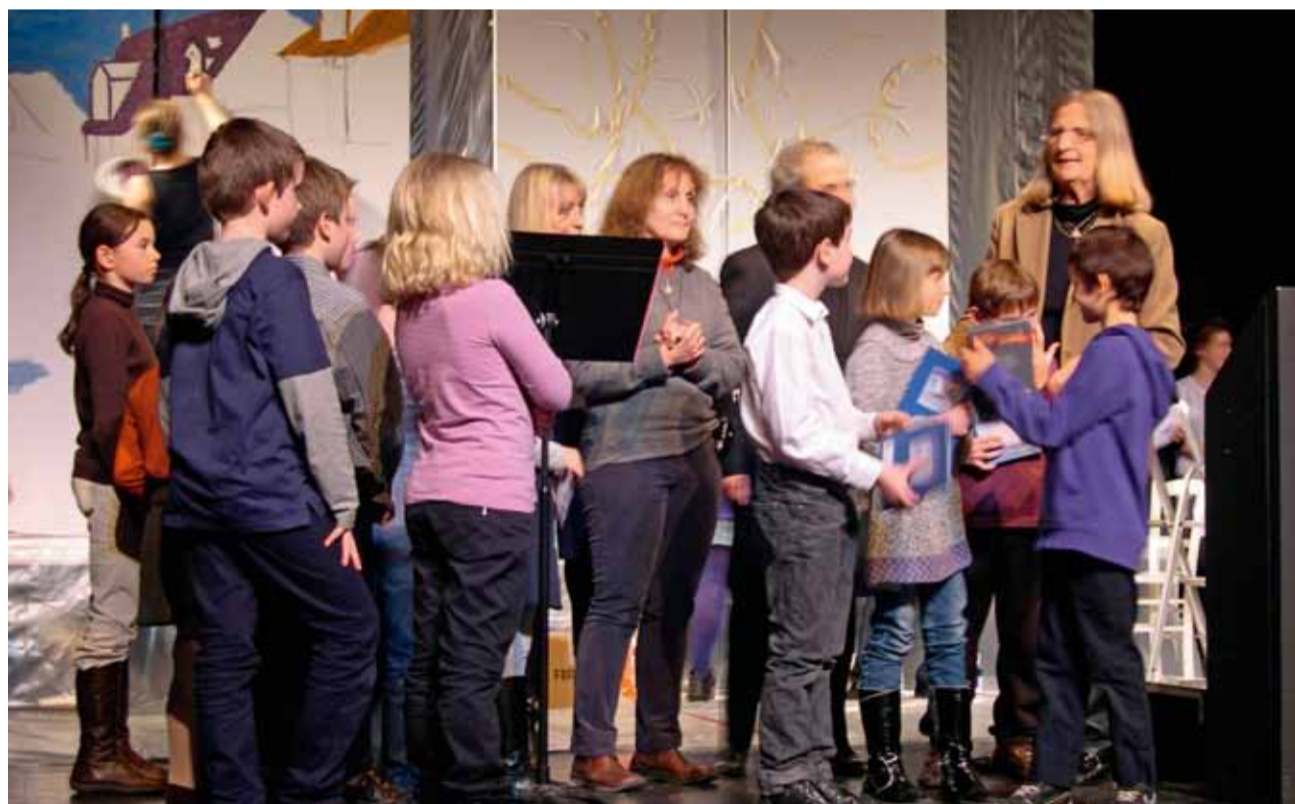
Cérémonie de remise des prix 2010

Retrouvez toutes les animations en page 7.