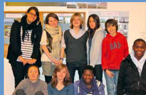
Les élèves du projet

Le mardi 14 décembre dès 7 h 30, les élèves du « Projet Santé » du collège La Fontaine du Roy ont organisé pour tous leurs camarades de 4 e (140 élèves) un petit déjeuner équilibré. L'objectif étant de faire prendre conscience aux adolescents, de l'importance de ce repas pour commencer une journée en pleine forme mais aussi de leur montrer de quoi doit se composer ce petit déjeuner, afin qu'ils puissent par la suite manger équilibré et disposer de toute l'énergie nécessaire pour une vie de collégien.